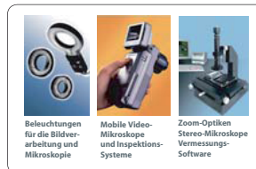
Beleuchtungen für die Bildverarbeitung und Mikroskopie Mobile Video-Mikroskope und Inspektions-Systeme Zoom-Optiken Stereo-Mikroskope Vermessungs-Software